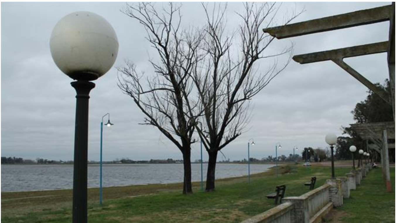
La laguna Las Mulitas.