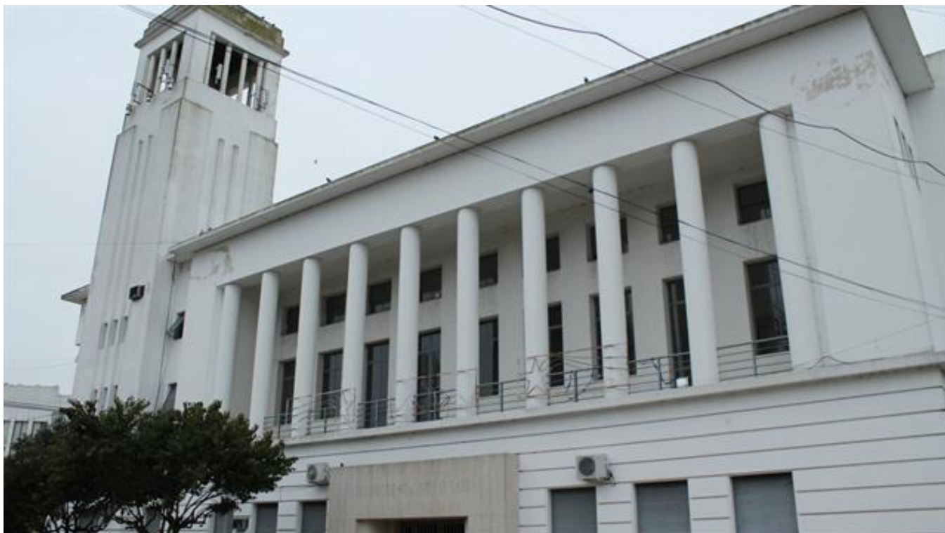
La Municipalidad de 25 de mayo.