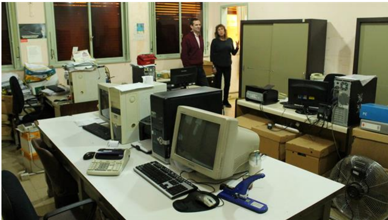
La contaduría de la Municipalidad de 25 de mayo.

Mancha dejó el monitoreo y fue corriendo hasta la oficina de Ticera, la Secretaria de Hacienda, quien a esa hora estaba reunida. No golpeó la puerta cerrada para entrar. "Me interrumpe y me dice: "nos están robando, nos están robando". Entonces miré alrededor para buscar un revólver, un ladrón. Pero no había nadie. "¡Nos están sacando plata de las cuentas!", me aclara la subcontadora. No entendía nada. Dejé la reunión y corrimos nuevamente a contaduría", recuerda. Ya con el doble chequeo, fueron a buscar al Intendente: "Salimos disparadas".