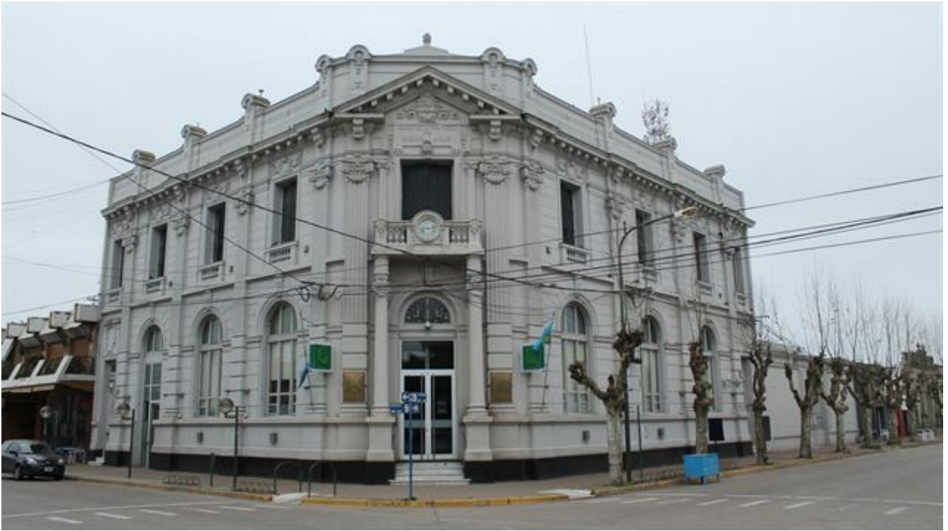
La sucursal del Banco Provincia de 25 de mayo.

Entonces, recibieron al menos una buena noticia: lograron que les bloquearan las cuentas. Eran poco más de las 12.