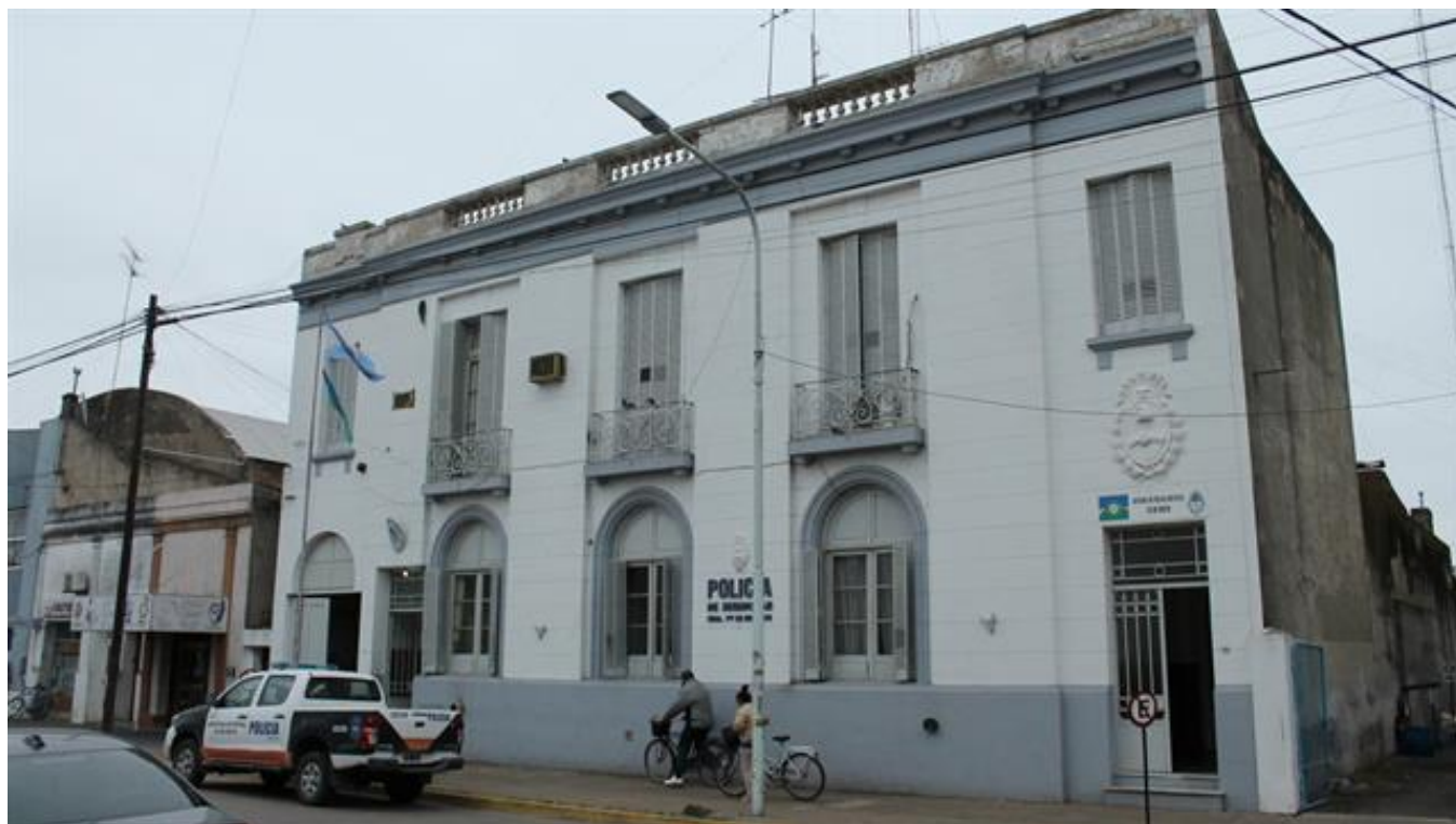
La comisaría de 25 de mayo.

Los delincuentes iniciaron las transferencias el domingo 20 a las 21.16. Para ello, enmascararon su localización. Las direcciones IP (una huella digital que en determinadas ocasiones permite determinar desde qué zona entra un usuario a una página) que figuran en los registros del Banco Provincia indican que los depósitos se hicieron desde diferentes zonas de Bolivia y Estados Unidos.